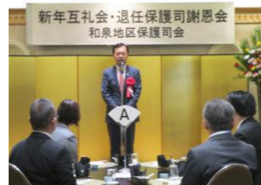
辻市長 『社会を明るくする運動』 推進委員長